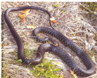
Couleuvre verte et jaune ( Coluber viridiflavus )