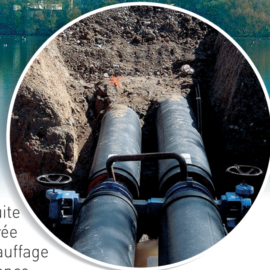
Conduite enterrée de chauffage à distance