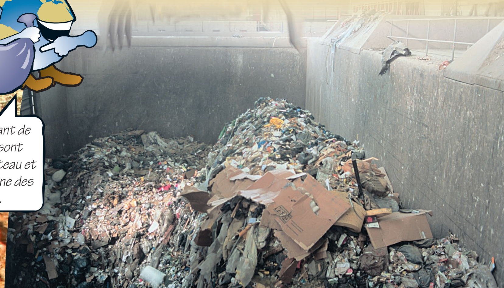
La fosse à déchets de l'usine des Cheneviers.

Les déchets venant de tout le canton sont acheminés par bateau et par camion à l'usine des Cheneviers.